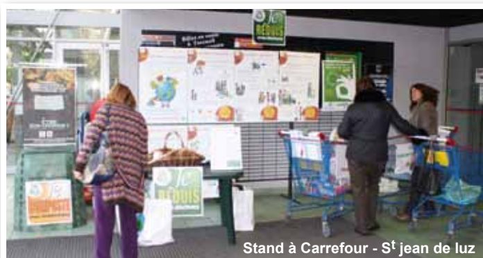
Stand à Carrefour - St Jean de Luz

Réduire le volume et le tonnage des déchets produits par les ménages est un souci constant. C'est pourquoi lors de la semaine nationale de la réduction des déchets, le Syndicat a organisé des actions de sensibilisation sur les lieux de consommation des citoyens. Trois supermarchés nous ont accueillis : Intermarché (Bidart) - Eau Vive (Bidart) - Carrefour (St Jean De Luz). L'animation a consisté à démontrer qu'il était possible de faire ses courses en intégrant la notion de déchets dès l'acte d'achat. Deux caddies comparatifs : un «maxi déchet» et un «mini déchet» étaient présentés